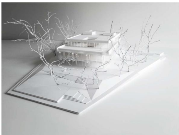
Maketa predvidene prenove objekta »Nama« z zunanjo ureditvijo