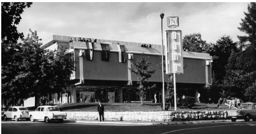
Pogled na objekt »Nama« po izgradnji prvotnega dela in terasne etaže.